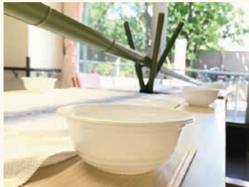
夏 竹を囲んで流しそうめん! 舌鼓!