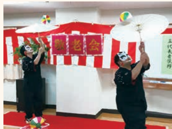
秋 敬老会では職員が出し物を披露!