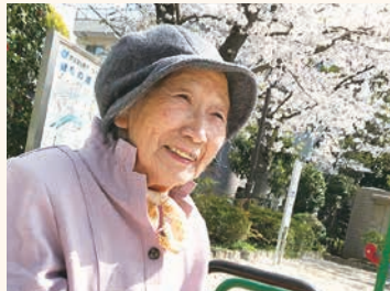
春 近所の公園には毎年桜が満開!

ひとつです。また、近所の保育園の園児さんやボランティアの方をお招きしたり、各種教室を開催したりして、地域との繋がりも大切にしております。子どもから大人まで、お気軽に立ち寄っていただけるような場所になれるよう努めてまいります。