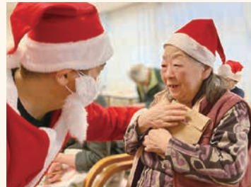
冬 サンタご来設♪ 贈り物は何かな?